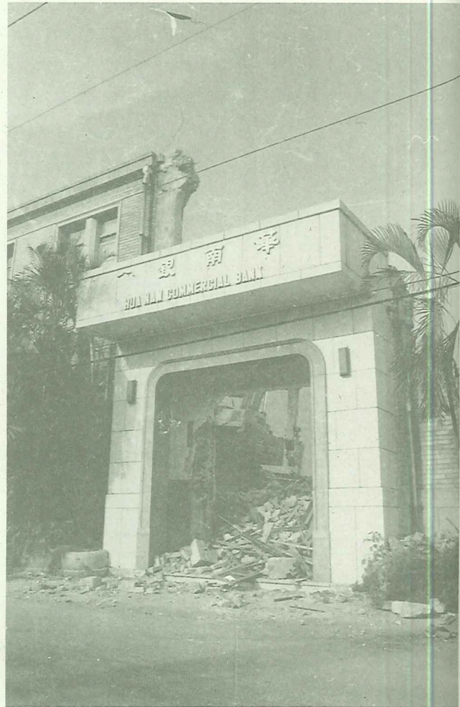
民國69年華南銀行進行改建

1950年代以前，今英專路附近沒有住家，只是一片田地，當初為了蓋英語專科學校（淡江大學）才特別開闢了一條人車通行的道路，成為